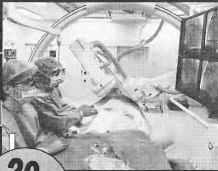
心臓カテーテル治療の様子 (岐阜ハートセンターにて)